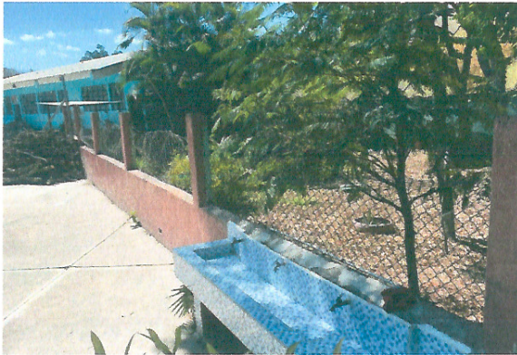
Foto 3: Remozar la malla del muro perimetral porque no esta en buenas condiciones.